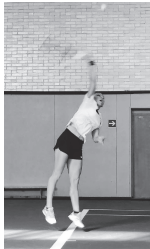
Hétfőn Moszkvában edzett, akkor még nem volt egyértelmű, hogy tudja-e vállalni a játékot vagy sem

Halep idén megnyerte a sencseni és a montreali tornát, valamint a Roland Garrost, illetve döntőt játszott az ausztrál nyílt teniszbajnokságon, Rómában és Cincinnati-ban is.