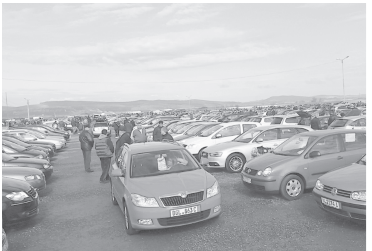
Sokan inkább használt autót vásárolnak

Az idei év első kilenc hónapjának adatait tekintve 2,5 százalékkal, 11,95 millióra emelkedett az utakra került új autók száma a 2017-es esztendő ugyanazon időszakához képest. A január és szeptember közötti hónapokban Romániában jegyezték a legnagyobb (31,5%-os) bővülést, aztán Litvánia (27%) és Magyarország (26,5%) következik a sorban. Romániában 103.595 autót adtak át ebben az időszakban, míg egy évvel korábban 78.769-et. (Agerpres)