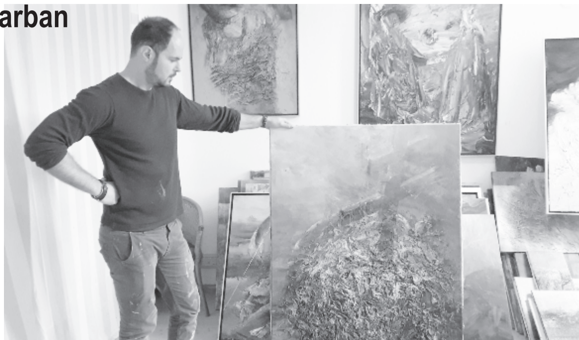
Szovátai műtermében a festő

Bár a tematikai változatosság indokolhatja a sorozatjelleg zárójelbe vételét, mégis közös nevező lehet mindezen képek esetében pl. az egyetemes létkérdések és létállapotok érzékelési kísérlete, vagy az örök érvényű ellentétek tranzícióinak keresése/viszonya: rend és káosz, tudat és intuíció, sötétség és derű, élő és élettelen, agresszió és érzékiség, statika és dinamika, pozitív és negatív, hagyomány és nonkonformitás. Ha ezen kettőségek egy képen