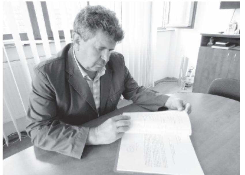
Legalább tucatnyi elképzelés, szükséglet megvalósításán dolgoznak, és legalább ugyanennyi tervben van – sorolja a polgármester

Hamarosan Székelybóbsa is eljut a vezetékhez. Régi tervük a víz- és csatornahálózat kiépítése a Koronkához tartozó faluban, pályázatot is készítettek rá, de nem kaptak támogatást, így most a község költségvetéséből látják hozzá a 6 millió lejes beruházáshoz. A kivitelezési versenytárgyalásra négy