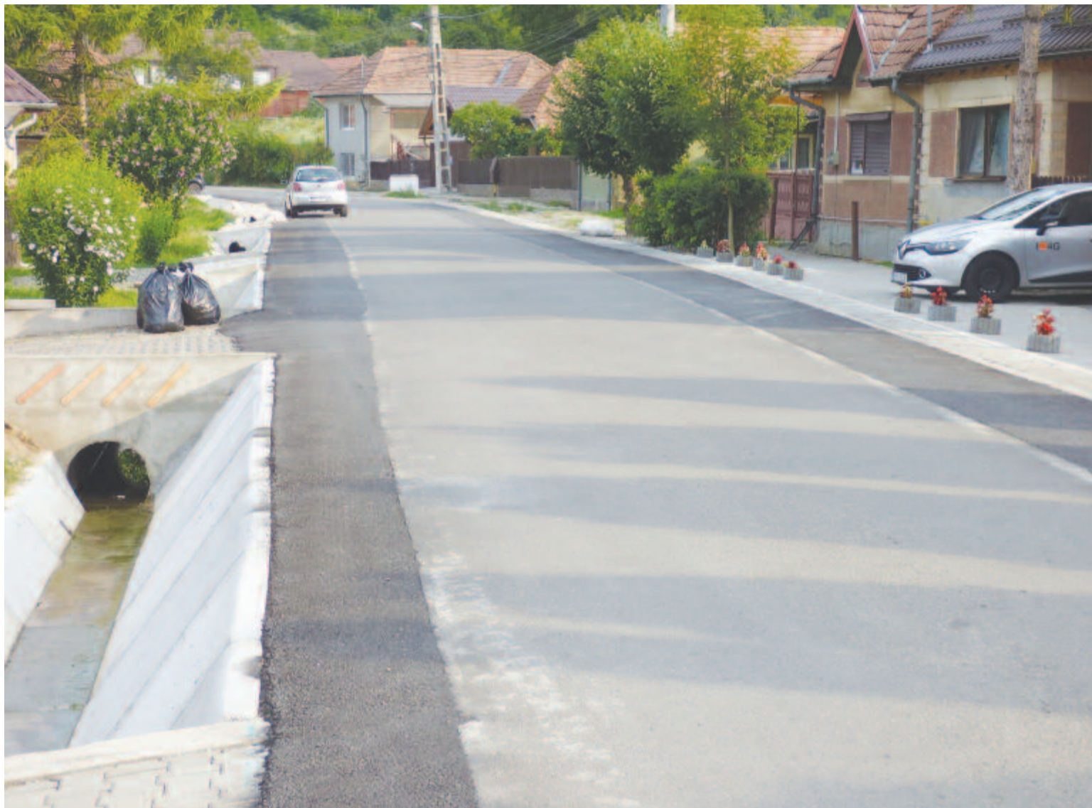
Idővel egységes arculatot kapna minden utca