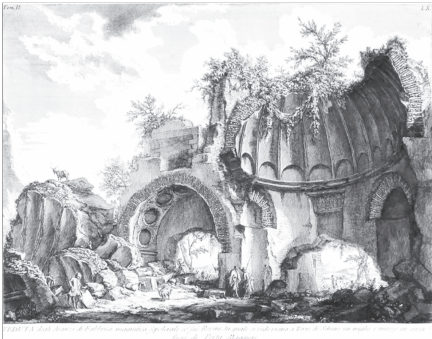
300 éve, 1720. október 4-én született Giovanni Battista Piranesi itáliai rajzművész, rézmetsző, építész, aki művészetelmélettel is foglalkozott. Az ókori Róma és környéke épületeit ábrázoló nagy méretű rajzaival öregbítette a város hírnevét, ösztönözte a klasszikus korszak régészeti kutatását, a klasszicista stílusirányzat kialakulását

Elvitt téged is a kor s a kór: Bukarestben jegyet váltottak neked a vörösszárnyú angyalok, kéretlenül, de nem véletlenül segítettek fölszedni batyudad, benne elvegyülve a kihegyezett lúdtoll, mely nélkül minden értelmét vesztené, jól tudtad, bár egy zsebkés, annyi még kéne, bárhol szükséged lehet rá, tudtad, amivel feltörhetsz egy diót, meglélkelhetsz egy mogyorót, meghámozhatod szalonna mellé a vereshagymát, de az nem maradt a zsebedben, a kés. Meglepő jóindulattal, szokatlanul készségesen mutatták, merre nyugszik le a nappalt lobbantó nap, az fog, ott fog majd tündökölni, ledobni fényt a Bélkő bérceiről, de kiszárvátva jöttek a fehér angyalok ott, s kísérték végig, végigkísérték a maradék Úton, hol a ciszterciek gyűjtogatták világító gyertyáikat, fölfelé menve a meredek hegyoldalon.