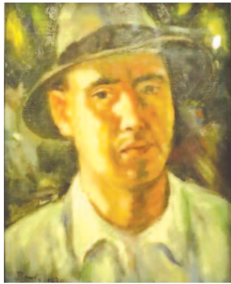
Bordy András: Önarckép, 1930

Marosvásárhely, november 12. A budapesti Múcsarnok a mindenkor magyar művészet hivatalos értékmérője. Kiállításai mindig eseményként mennek, ahol megjeleneni parancsoló kötelesség az haute volée tagjainak.