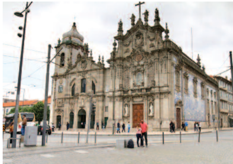
A karmelita és a Carmo templom

Az óváros központi részében vagyunk, sok a templom körülöttünk. Elsőnek a karmelita, illetve Carmo templomot nézzük meg. Ránézésre egy templomnak tűnik, de ahogy köze-