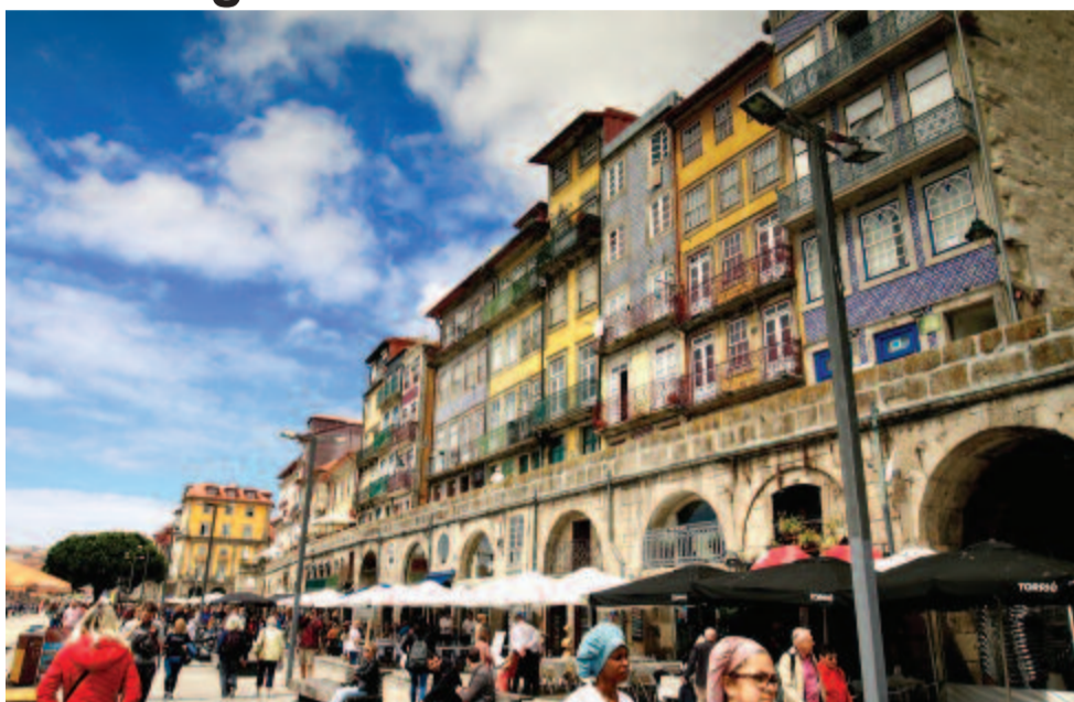
Lakóházak a Douro jobb partján