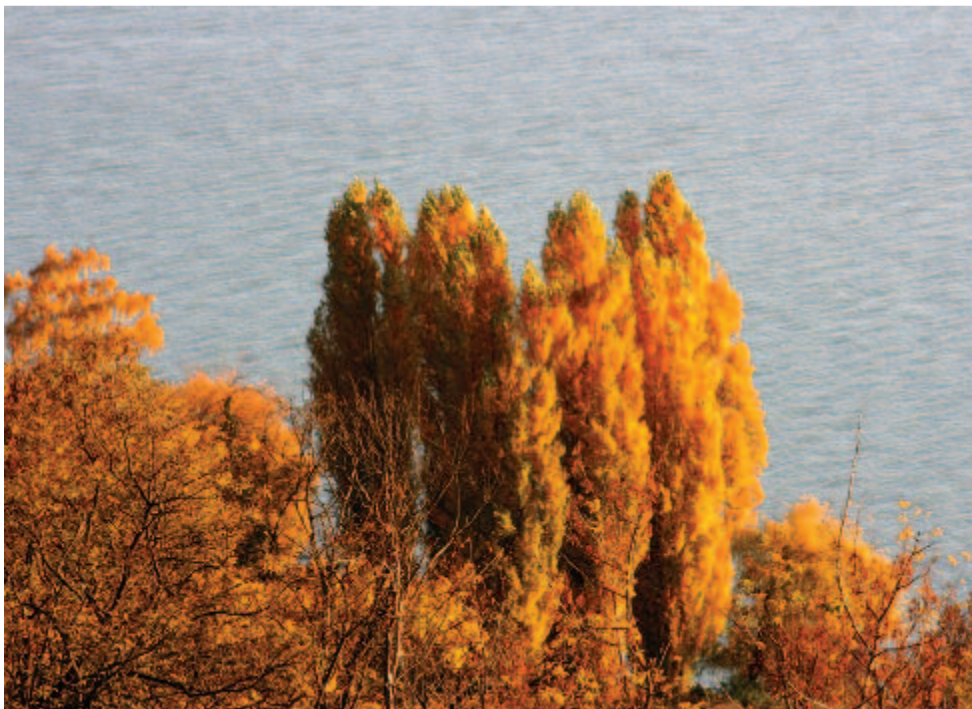
A sárga csöndben lázas vallomások

Vajh hány ezernyi, tízezer ember jutott betyárok sorsára az '56-os forradalom után is... Búskomor, eső áztatta őszből írja Jékely Zoltán is sorait 1944 októberéről: