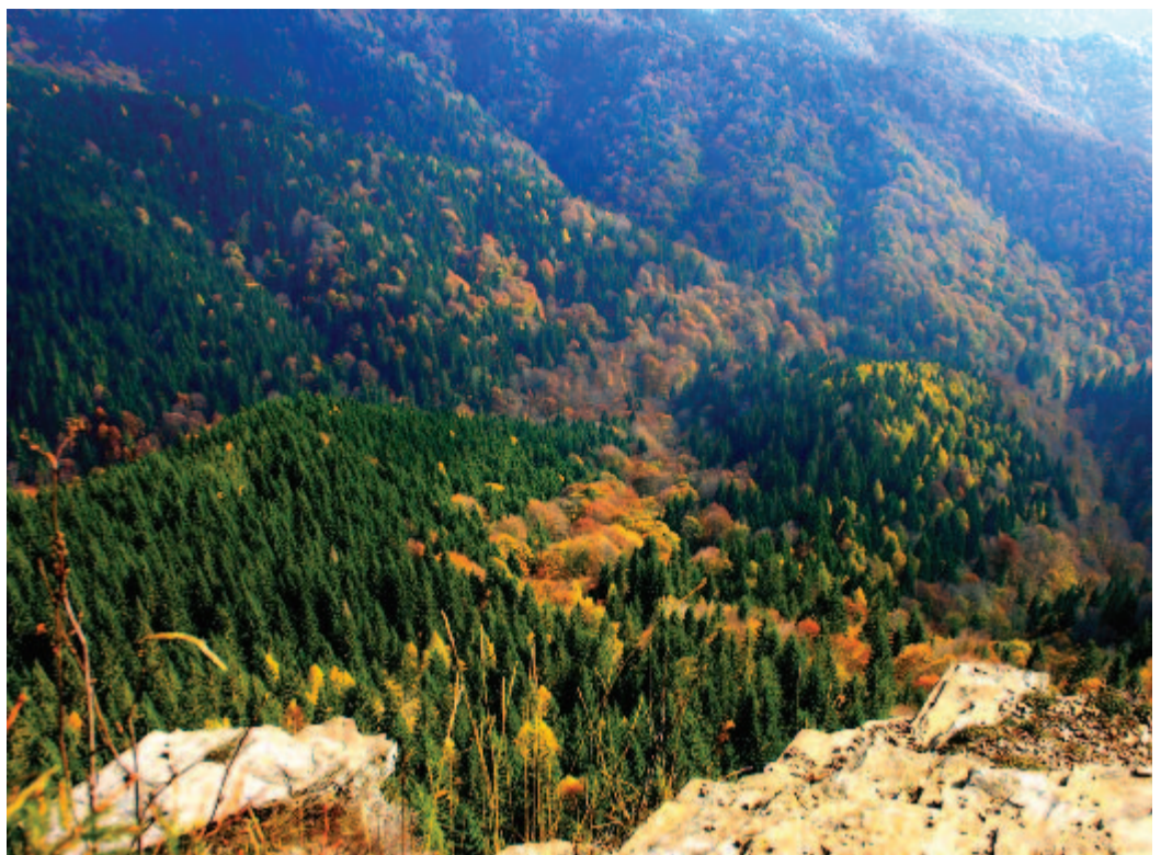
Sárga, bíbor és vörös mintázza az Istenszéke gyűrött hegyoldalát

Az eresz alól démonok lesnek rám: papir- vékony farkas-fülük folyton mozog. Szájuk szeder- jes vérfolt.