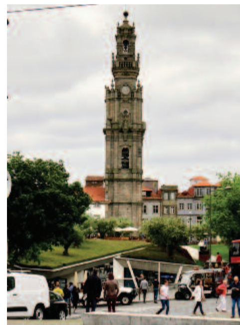
A Klerikusok Tornya