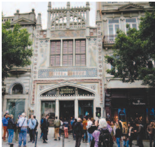
A Lello könyvesüzlet