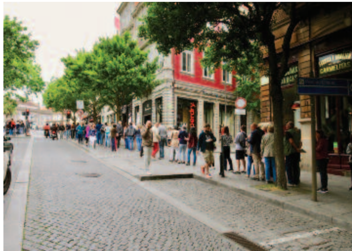
És a sor, hogy bejussunk